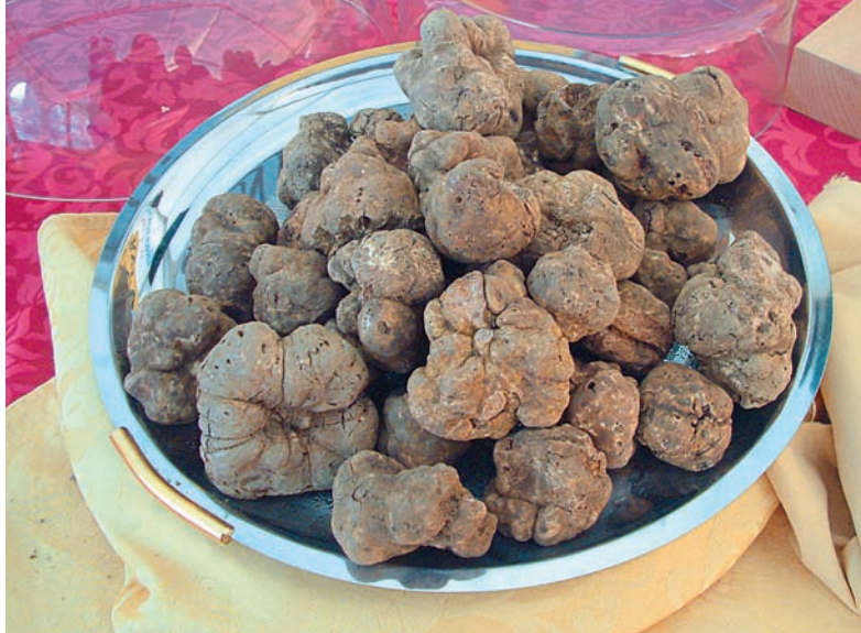
In Acqualagna ist immer Hochsaison für die aromatischen Knollen

Seit den Dreißigerjahren des 20. Jahr- hunderts kennt man hier das Geheim- nis der Symbiose zwischen Wurzeln und Pilzmycel und beherrscht damit die Kunst der Trüffelzucht. Die so- genannte Mycorrhiza – also die Sym- von Wurzeln und Pilzmycel – ist die Grundlage für das Gedeihen der edlen Knollen, die hier das ganze Jahr über gefunden werden.